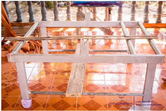
โหมทอเสื่อ