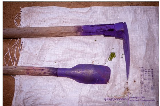
จอบ/เสียม (ใช้พลิก/ กลับ กกตอนข้อม)