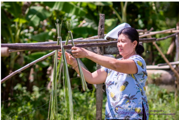
ราวไม้ไผ่สำหรับตากกก