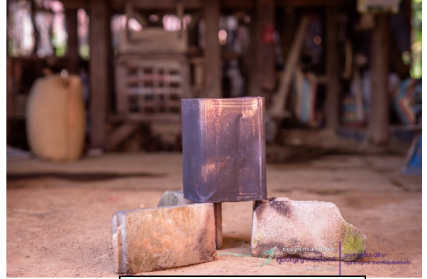
อิฐบด 3 ก้อน (ตั้งเป็นเตา)