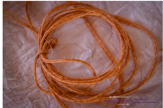
เชือกไนลอน หรือเชือกตำลึง