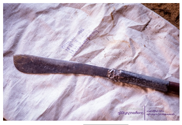
มีดผ้าฟัน