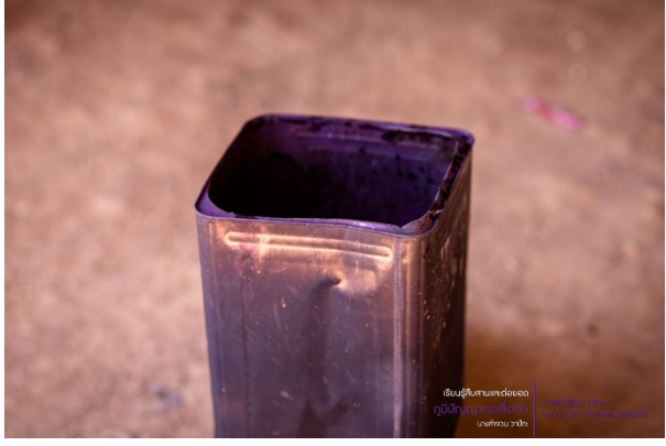
ปิ่น สำหรับตักน้ำ