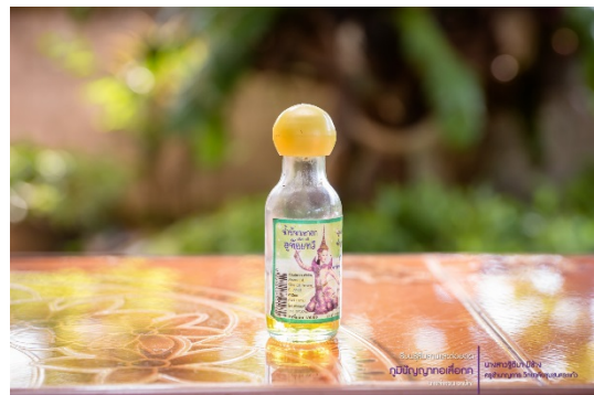
น้ำมันมะกอก